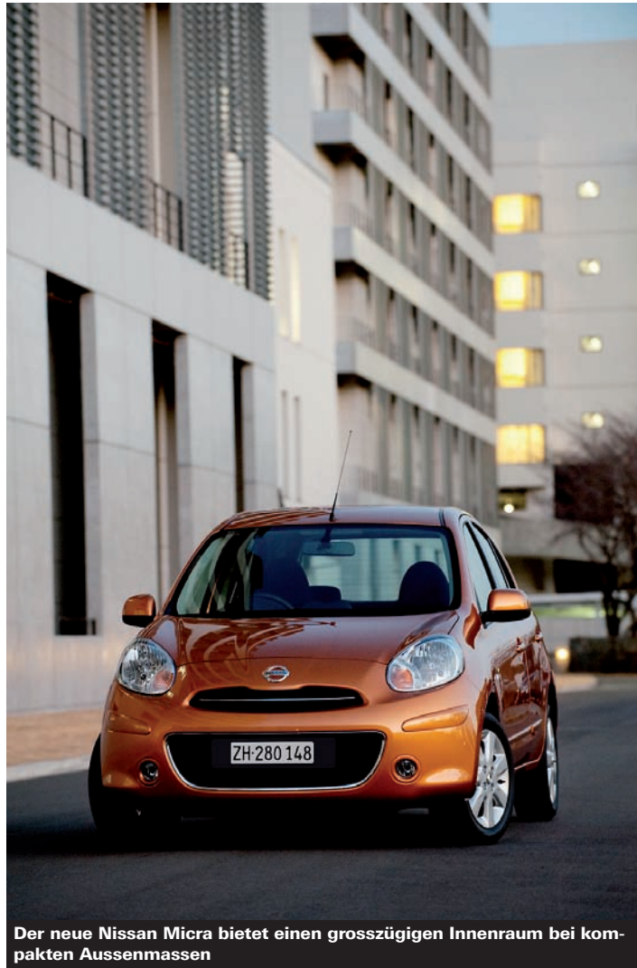
Der neue Nissan Micra bietet einen grosszügigen Innenraum bei kompakten Aussenmassen

Als erstes Nissan-Modell steht der Micra auf der neuen V-Plattform, die sich durch hohe Steifigkeit und geringes Gewicht auszeichnet. Sie ist zusammen mit den sparsamen Motoren ein entscheidender Faktor für die hervorragenden Verbrauchs- und Emissionswerte. Für den Antrieb stellt Nissan zwei neu entwickelte Dreizylinder-Ottomotoren mit 1,2 Liter Hubraum bereit. Das Basisaggregat mit Saugrohreinjection entwickelt 59 kW/80 PS Leistung und emittiert lediglich 115 Gramm CO 2 pro Kilometer. Noch effizienter ist das ab Frühjahr 2011 erhältliche Triebwerk. Es arbeitet mit Kompressoraufladung und Direkteinspritz-