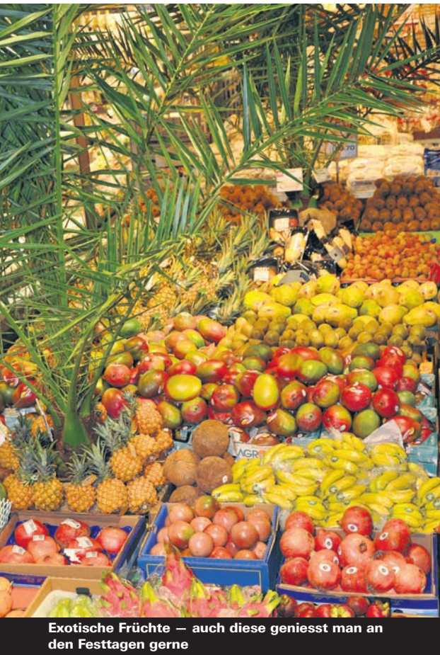
Exotische Früchte — auch diese geniesst man an den Festtagen gerne