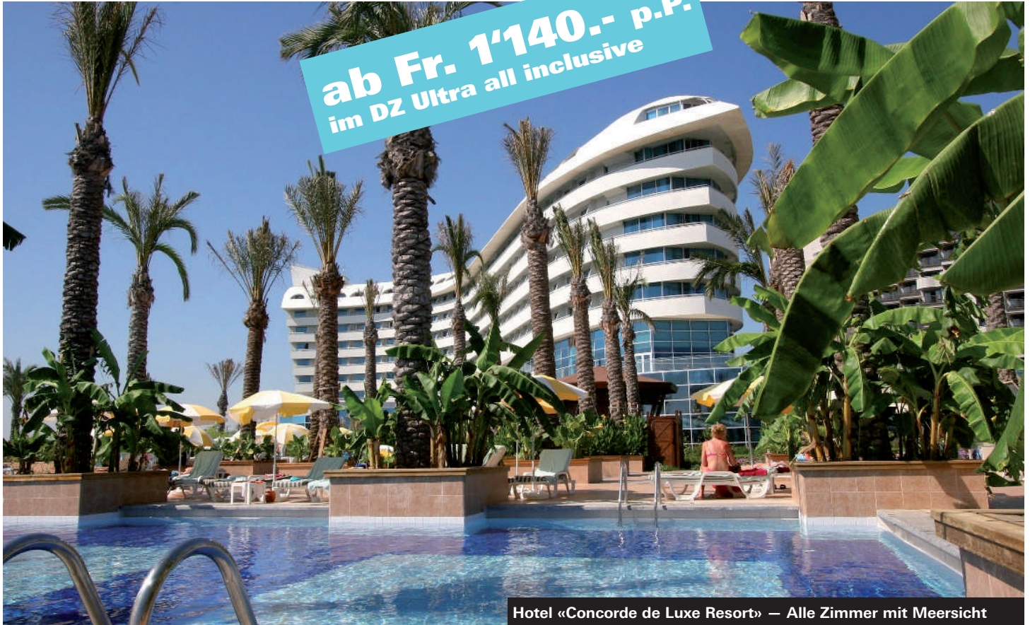
Hotel «Concorde de Luxe Resort» — Alle Zimmer mit Meersicht

ab Fr. 1'140.- p.P. im DZ Ultra all inclusive